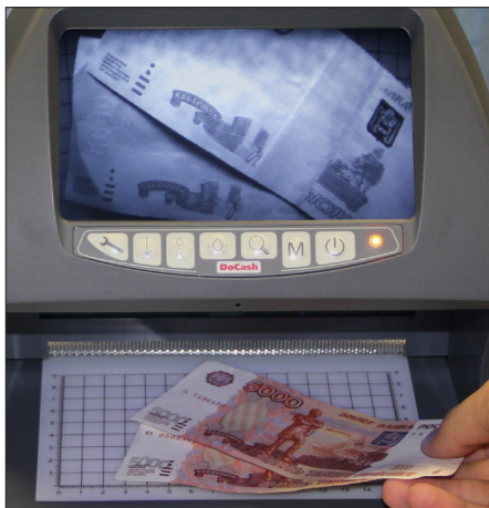
Идентификация ИК-меток на 5000-купюре

Включение косопадающего света позволяет выявлять оптически переменную краску.