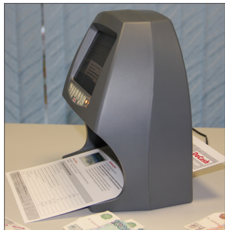
Для удобства проверки документов формата А4 с тыльной стороны прибора имеется прорезь

Среди явных преимуществ детектора — удобная панель управления и широкая просмотровая зона, которая позволяет проверять банкноты веером, а самое главное, большой 7-дюймовый экран, на который выводится изображение денег в масштабе